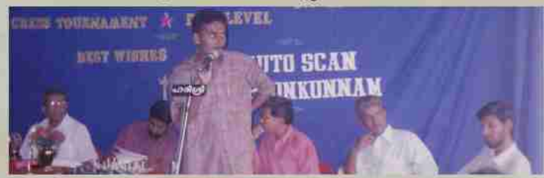
നന്ദി: എം. ബി. ബാബു, സെക്രട്ടറി, റോഡ് സ്റ്റാർ ക്ലബ്ബ്