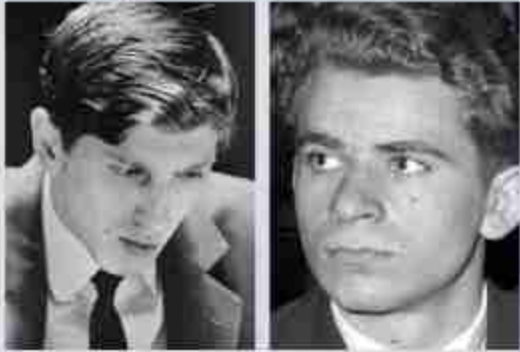
ബോബി ഫിഷർ ബോറിസ് സ്പാസുകി

ആയിരത്തി തൊള്ളായിരത്തി എഴുപത്തി രണ്ടാമാണ്. ഞാനെന്ന്, എട്ടാം ക്ലാസിൽ പഠിക്കുന്നു. ഇക്കാലത്താണ്, ബോബി ഫിഷർ എന്ന ചെസ്സ് മാന്ത്രികനെ കണ്ടുറിച്ചറിയുന്നത്. കൃത്യമായി പറഞ്ഞാൽ, ഐസ്ലാന്റിൽ നടന്ന ഫൈനലിൽ റഷ്യക്കാരൻ ബോറിസ് സ്പാസുകിയെ ഫിഷർ തോല്പിച്ചപ്പോൾ മുതലാണ്. ചെസ്സ് കളിക്കണമെന്ന ആഗ്രഹം ഉടലെടുക്കുന്നത്.