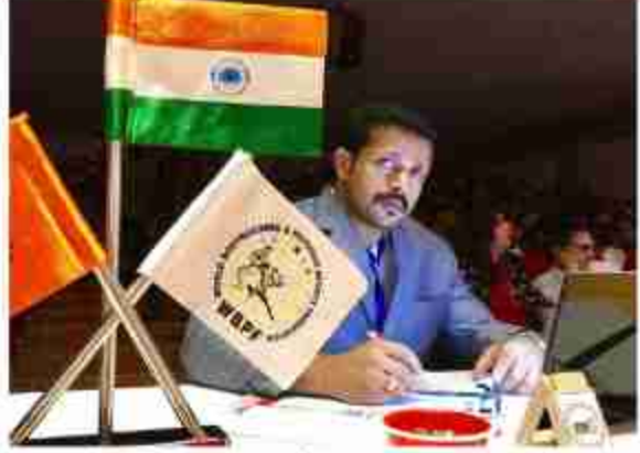
2021ൽ, പുനയിൽ നടന്ന മിസ്റ്റർ ഇന്ത്യ മത്സരത്തിൽ ജഡ്ജിയായിരുന്നപ്പോൾ.

95ലാണ്, 'മിസ്റ്റർ ഇന്ത്യ' മത്സരത്തിൽ പങ്കെടുക്കുന്നത്, കൊൽക്കത്തയിൽവെച്ച്. അതേ വർഷംതന്നെ, തിരുവനന്തപുരത്തു നടന്ന ജൂനിയർ വിഭാഗം മത്സരത്തിൽ 'മിസ്റ്റർ കേരള' യായിരുന്നു. കൊൽക്കത്തയിലെ മത്സരം സംഘടിപ്പിച്ചത്, ഇന്ത്യൻ പ്രതിരോധ മന്ത്രാലയത്തിന്റെ കീഴിലുള്ള ഓർഡിനൻസ് ഫാക്ടറീസ് സെർവീസ് (IOFS) ആണ്. ആ മത്സരത്തിൽ, ബെസ്റ്റ് പോസിംഗ് അവാർഡ് ലഭിച്ചു.